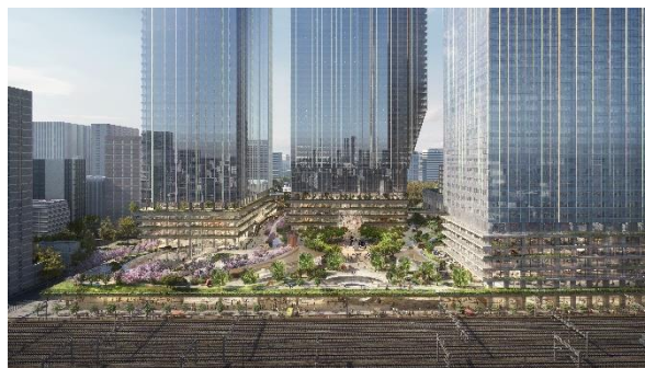
銀座側から2haの大規模広場を臨む(イメージ)