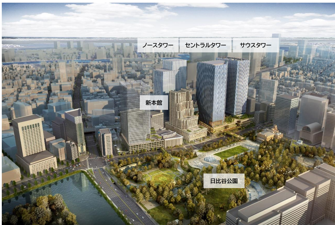
内幸町一丁目街区完成イメージ

街の価値を最大化するため、当街区のマスターデザイン・空間づくりには、ロンドンを拠点に活動する PLP アーキテクチャーを起用し、当街区の特性である 6.5ha もの広大な敷地、帝国ホテル新本館と 3 棟の超高層タワーが織りなすスケール感、日比谷公園に隣接する立地を最大限に活かします。日比谷公園の緑と水、アクティビティの可能性を広げる多様なパブリックスペースが計画された、街としての個性と調和が共存したデザインとしています。