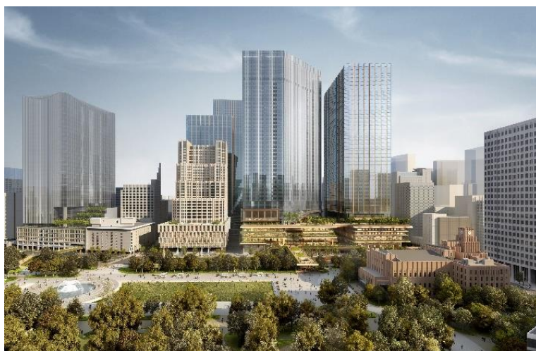
内幸町一丁目街区完成イメージ