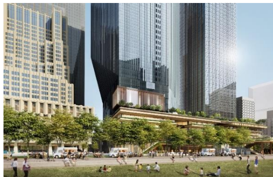
日比谷公園から街区を臨む(イメージ)