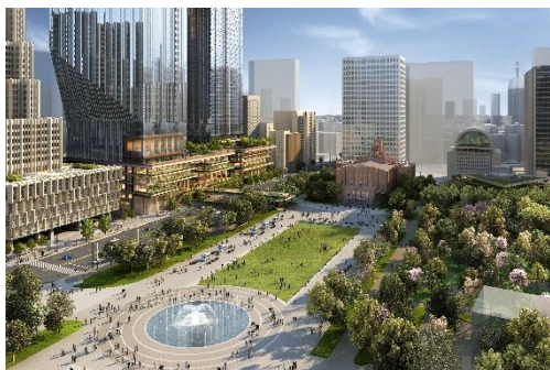
街区と日比谷公園をつなぐ道路上空公園(イメージ)