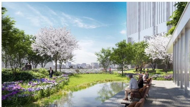
31m 基壇部上広場(イメージ)

※「カーボンマイナス」とは、CO 2 排出量実質ゼロに加え、CO 2 を吸収する技術等の導入により、当街区にて排出される電気・熱エネルギーの CO 2 排出量を実質マイナスとするもの。