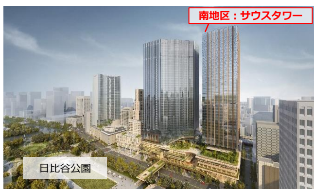
▲内幸町一丁目街区完成イメージ

本事業は、「(仮称)内幸町一丁目街区開発プロジェクト」の事業構想として本年3月に発表した「TOKYO CROSS PARK構想」のうち、「南地区」(サウスタワー等)にかかる再開発事業です。街区全体は北地区・中地区・南地区で構成され、約16haの日比谷公園とつながるとともに、都心最大級の延床面積約110万㎡を開発します。本事業(南地区)では、オフィスや商業施設、ホテル、ウェルネス促進施設を備え、比類なき街づくりの一翼を担う予定です。