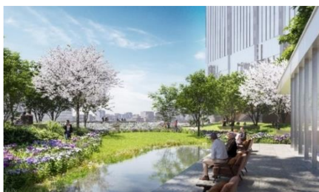
▲31m 基壇部上広場(イメージ)